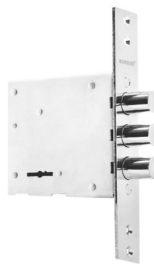
BORDER G 8-6 E Liežuvėlio skersmuo 16mm 4 atsparumo įsilaužimui klasė Rakinama plokščiu raktu